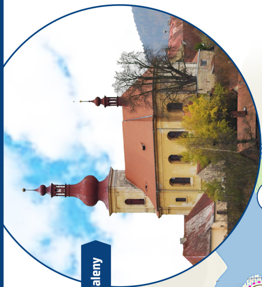
Kostel svatě Máří Magdaleny